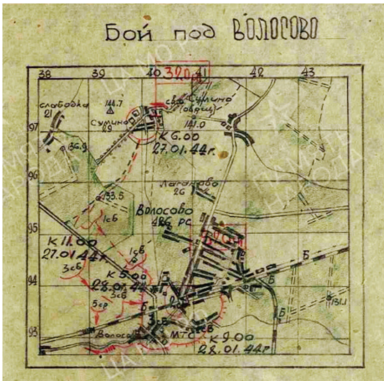
Схема боя за Волосово 27 января 1944 г. из Журнала боевых действий 320-го стрелкового полка.