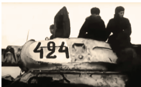
Фрагмент Союзкиножурнала № 10, февраль 1944 года: прохождение танковой колонны по дорогам Ленинградской области. Номера на броне позволяют предположить, что на кадрах кинохроники запечатлены танкисты 30-й гвардейской отдельной танковой бригады