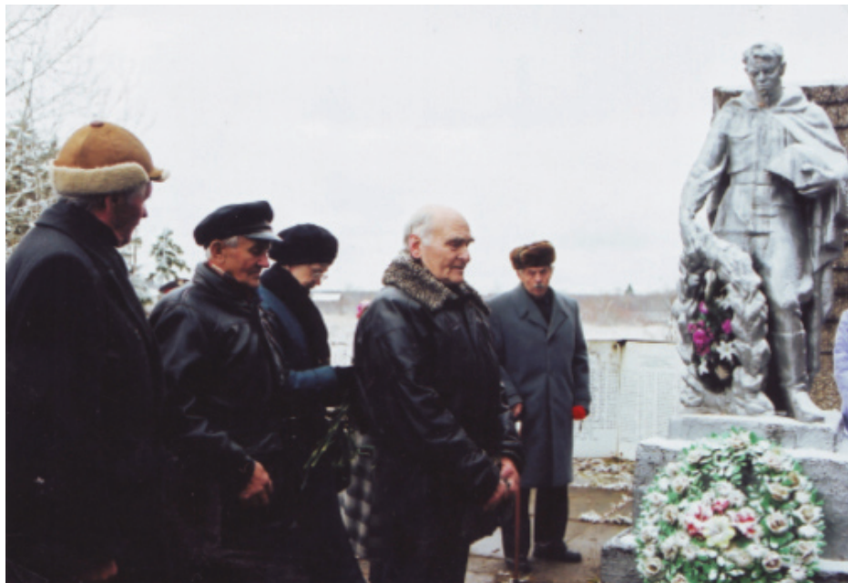
Выезд в д. Губаницы на место боя и гибели командира бригады. Ветераны у братского захоронения в д. Губаницы.