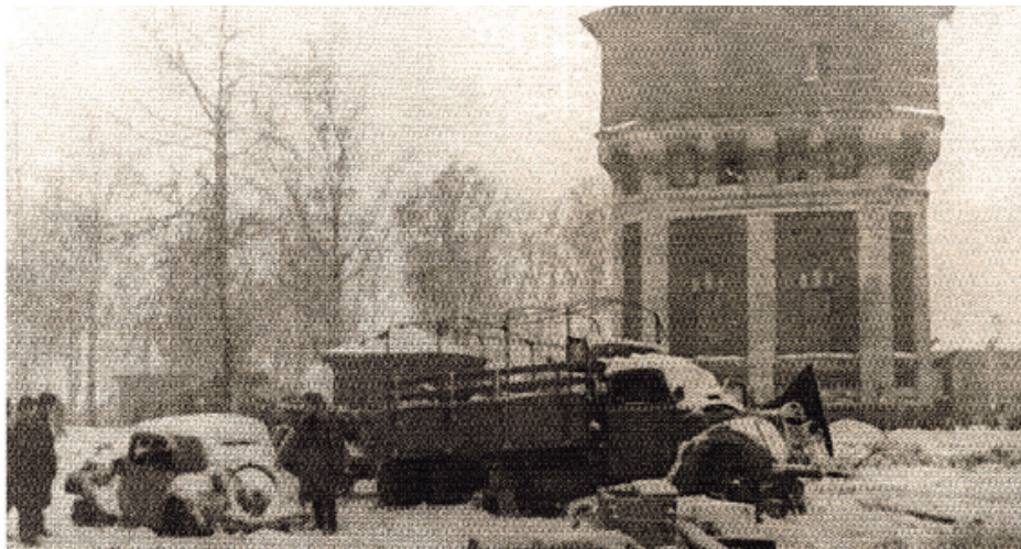
Захваченные на станции Волосово немецкие автомашины. 11 февраля 1944 г.