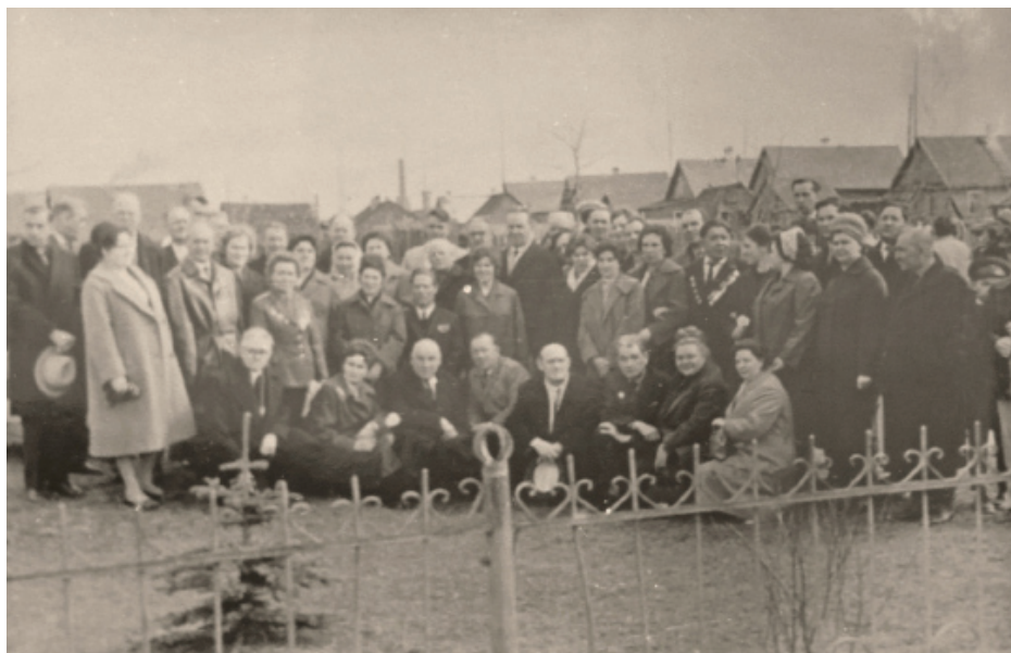
Ветераны 30-й гвардейской танковой бригады у братского захоронения в г. Волосово. 9 мая 1966 г.