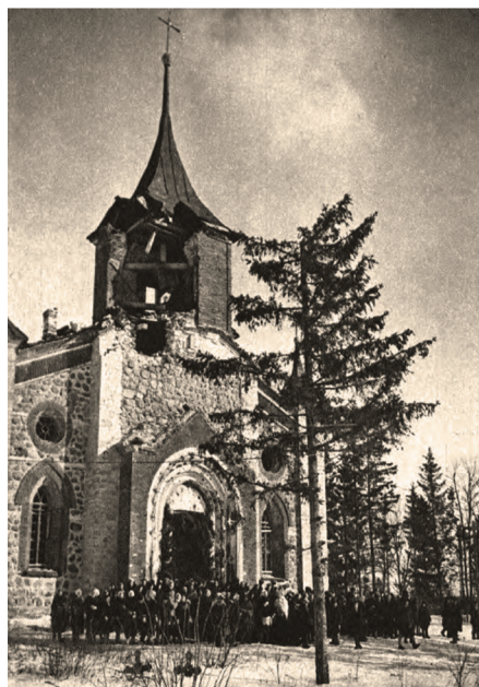
Повреждённая кирха Святого Иоанна Крестителя в Губаницах