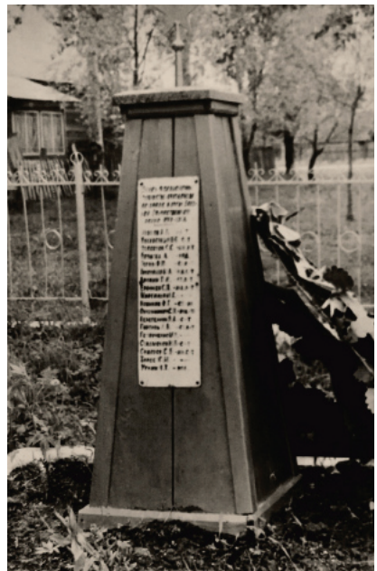
Братская могила танкистов 30-й гвардейской танковой бригады, погибших в бою 27 января 1944 г. Список на памятнике соответствует списку братской могилы №1 (100 м. южнее здания жд станции Волосово). Август 1978 г.