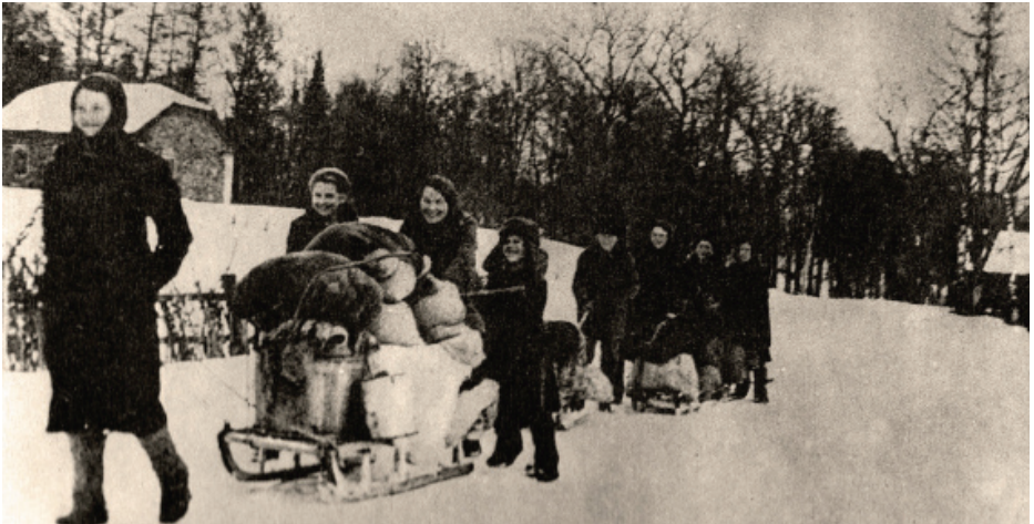
Жители села Торосово возвращаются домой после освобождения района от немецкой оккупации. Волосовский район, Ленинградская область, 1944 год.